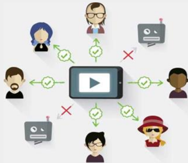
VHT - Verified Human Traffic

Para garantir a entrega da campanha apenas para pessoas reais, a Navegg desenvolveu o Verified Human Traffic , uma tecnologia antifraude que identifica o comportamento de navegação de humanos e robôs. Essa tecnologia está presente em todas as audiências da Navegg , mas também disponibilizamos o segmento VHT nas principais DSPs. Ative e garanta o brand safety na sua campanha.